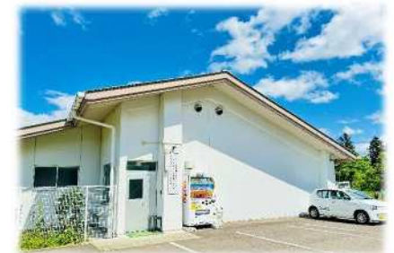
清心荘 指定相談支援事業所