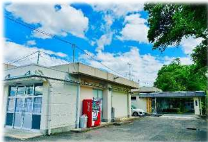
障害者支援施設 大萱荘

〔種類〕 小規模多機能型居宅介護事業所 定期巡回・随時対応型訪問介護 看護事業所