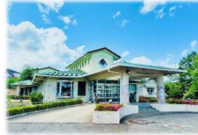
陽光園介護支援センター