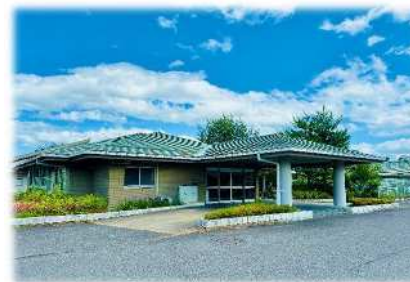
障害者支援施設 清心荘