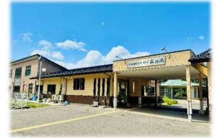
地域密着型介護事業所 森の風

〔種類〕 デイサービスセンター 指定短期入所生活介護 指定居宅介護支援 包括支援センター