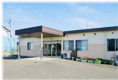
鎌田障がい福祉センター きらら